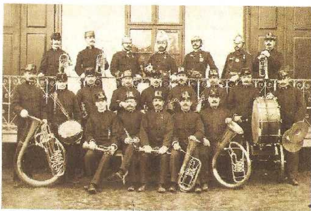
4. kép. A Sepsiszentgyörgyi T zoltó Egylet zenekara (1894)

A T zoltóegylet 80 taggal belép az Országos T zoltóegyletek Segélyszövetkezetébe, 1893-ban kilépnek és megalakítják saját segélyezési alapjukat. A t zoltó gyakorlatok helyszíne a Református Kollégium tornacsarnoka és a Benk -féle kert. 1878-ban két t zoltó Budapesten tanfolyamot végez és az ott tanultakat ültetik át a helyi t zoltói gyakorlatba. 25 év alatt 57 t zoltó sikeresen m ködnek, közben t zoltótornyot alakítanak ki a Bazár-épületben, valamint szirénát telepítenek a riasztás céljából. A t zoltózenekar 1894-ben alakul, amely számos városi rendezvény (ünnepélyek, március 15-i megemlékezés, Székely Nemzeti Múzeum alapkövetése stb.) közreműködője. (4. kép) [5]