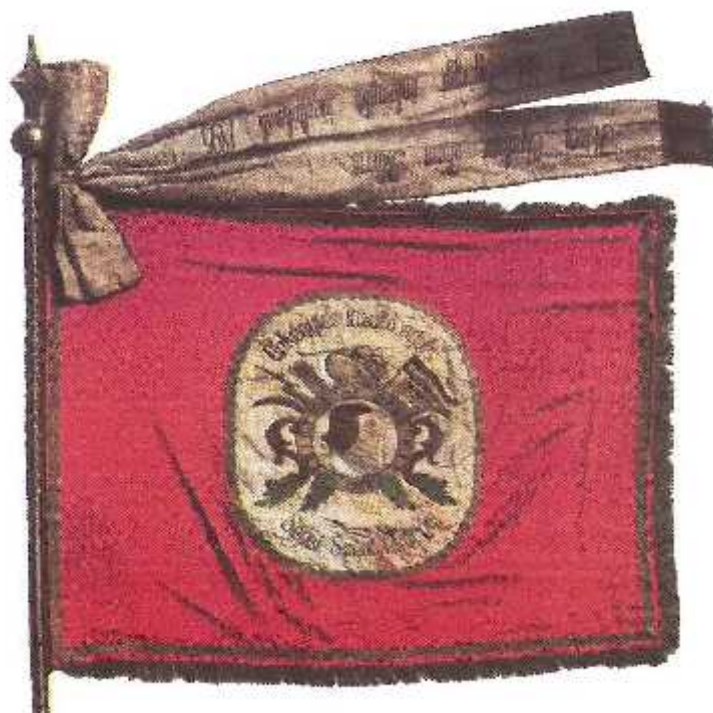
3. kép. A Sepsiszentgyörgyi T zoltó Egyesület zászlója (1895)

bályt 1891-ben fogadja el a belügyminisztérium. 5 Az egyesület zászlaját (3. kép) 1895-ben szentelik fel. [5]