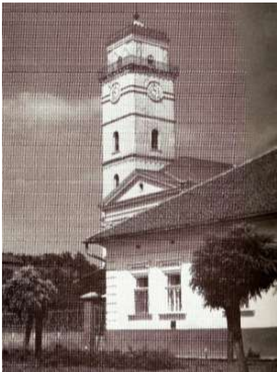
5. kép. Kunmadaras nagyközség református templomának tornya.

Kunmadarason, mint igazi alföldi településen, ahol ipari létesítmény - a téglagyáron és malmon kívül - nincs, az emberek zöme növénytermesztéssel és állattenyésztéssel foglalkozik. Ez a tűzoltóság tűzvédelmi - a tűz megelőzési, beavatkozási - tevékenységét alapvetően a mezőgazdasággal összefüggő területekre korlátozza. Ez azért nem olyan egyszerű, mert a település építkezési kultúrája, az állattartás, a nyári mezőgazdasági munkák - elsősorban az aratás és a cséplés, a gőzvontatású vasúti közlekedés, a mezőgazdasági gépek üzemanyagának szabadtéri tároló helyei sok-sok tűzveszélyt rejtnek magukba.